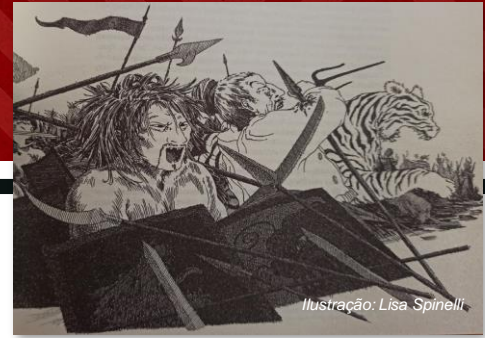
Ilustração: Lisa Spinelli

Centro Científico e Cultural de Macau CIÊNCIA, TECNOLOGIA E ENSINO SUPERIOR